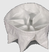
M-Filter + antistatisch